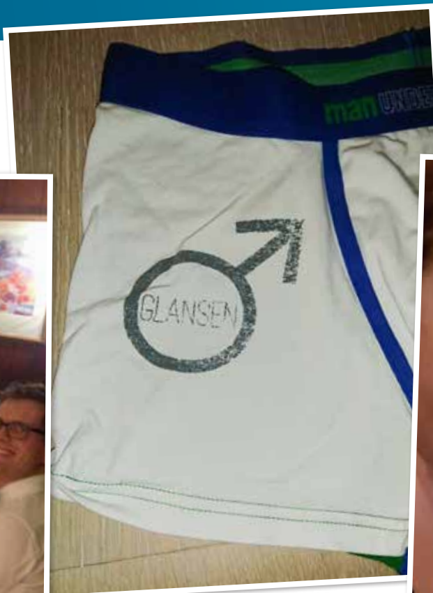
Sannsynligvis den eneste sykepleierklubben med egen boxer og egen ølbrygger...