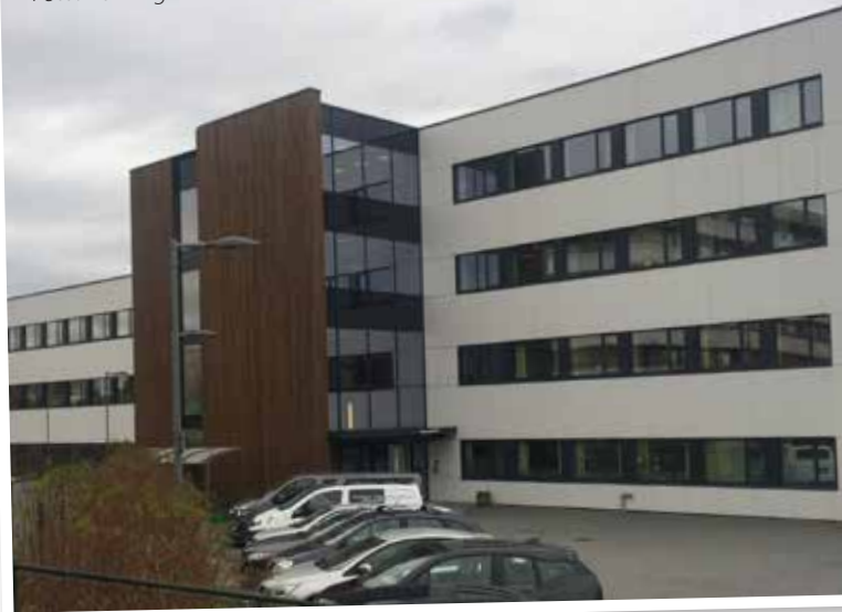
Stavanger DPS holder hus i moderne lokaler på Stokka i Stavanger.

NSF Lokalen ønsker Stavanger DPS lykke til videre med det viktige arbeidet de utfører.